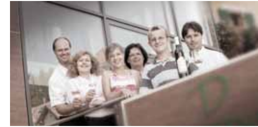
Familie Domittner freut sich schon jetzt auf Ihren Besuch im Klöcherhof.

Nehmen Sie sich auch Zeit, unsere Vinothek zu besuchen oder erkunden die schöne Umgebung: Neben der Riegersburg, die Landeshauptstadt Graz ist auch die Parktherme Bad Radkersburg ein beliebtes Ausflugsziel.