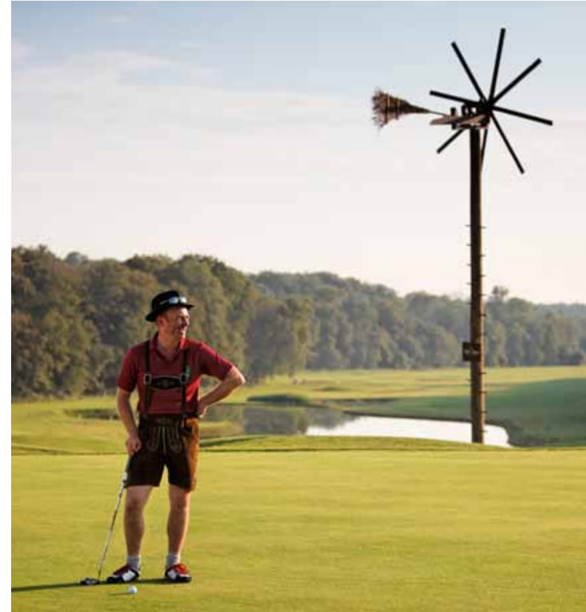
Nicht nur landschaftlich, sondern auch spielerisch eine neue Herausforderung: Traminer golf in Klöch.