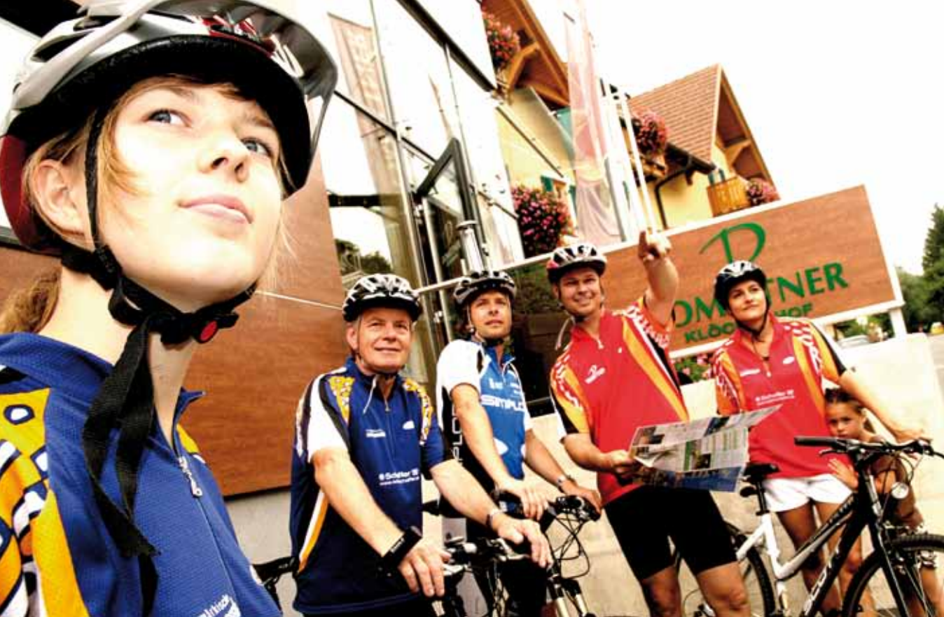
Manche haben es gerne eben und manche lieben es steil. In dieser Region finden Sie alle Möglichkeiten zum Biken.