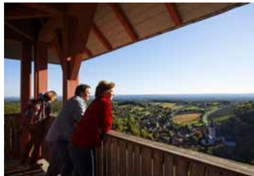
Auf der Burgruine, unmittelbar oberhalb des Hotels, wird in den Sommermonaten Theater gespielt oder Konzerte abgehalten. Der Traminerweg zählt zu den beliebtesten Wanderstrecken.